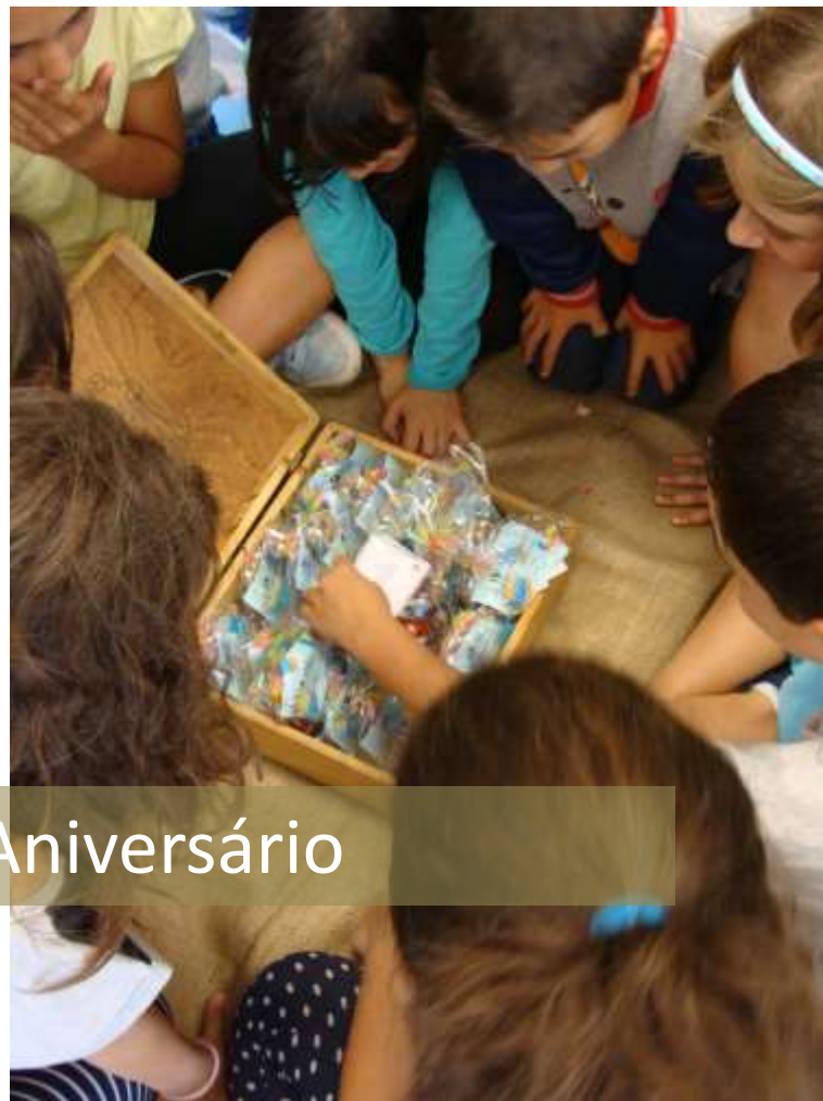
Festas de Aniversário