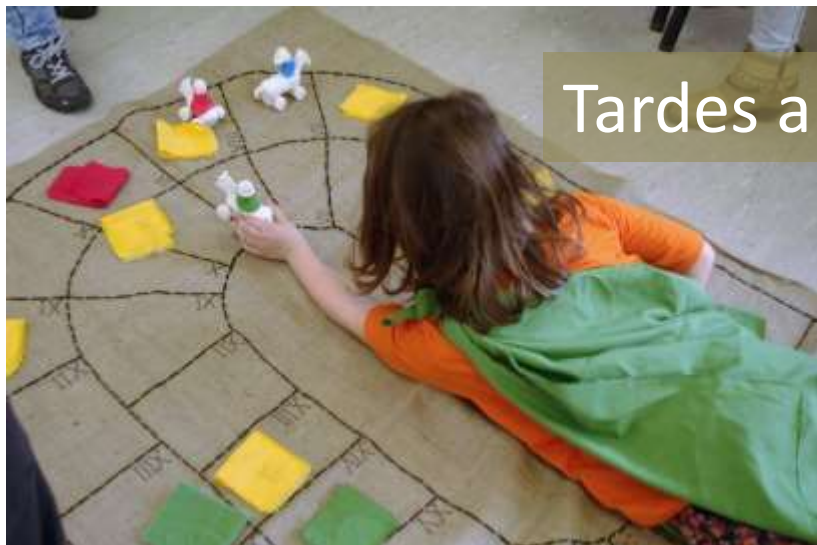
Tardes a Jogar